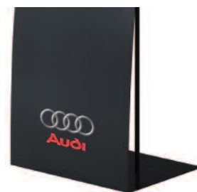
Distributeur de documents A4, A5, 1/3 A4